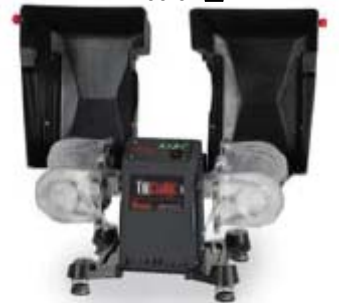
1400 Classic Shaker Shown