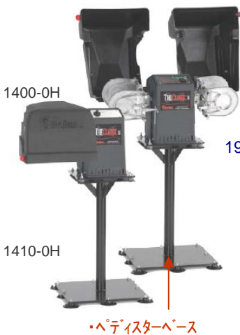
19mmの左右ピストン運動